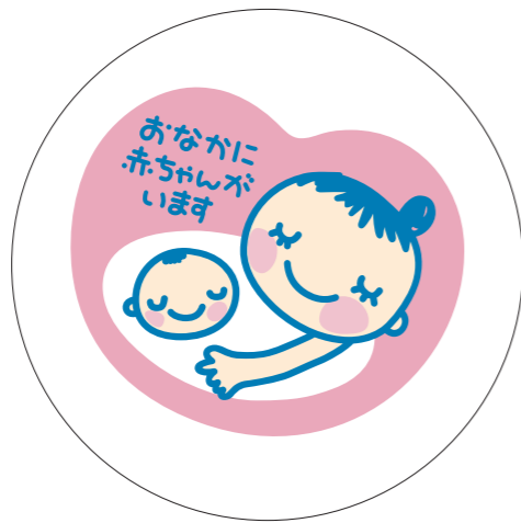
展開形 1(白マド付き) *スキケイはアタリ