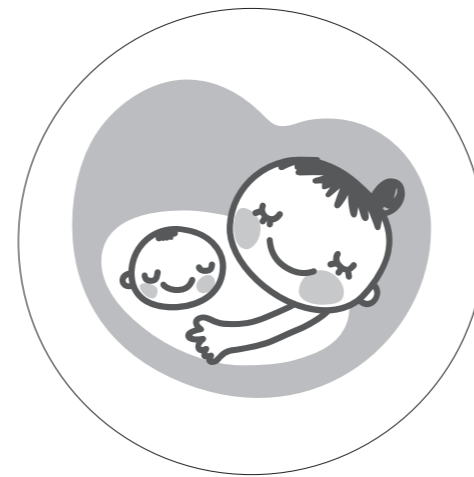
基本形(白マド付き) *スキケイはアタリ