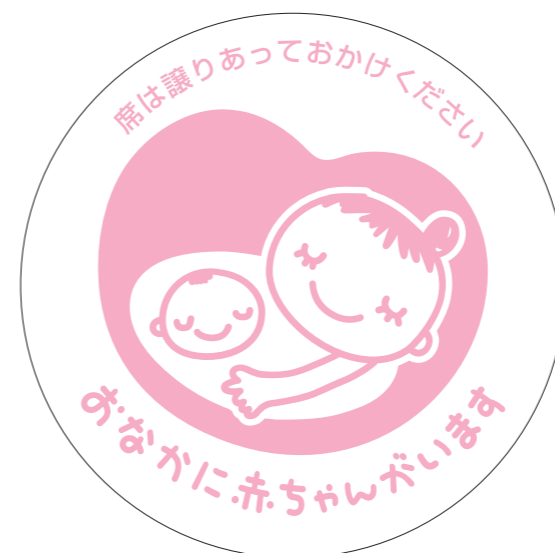
展開形使用例①(白マド付き) *スミケイはアタリ