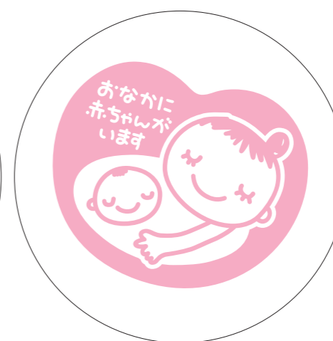
展開形 1(白マド付き) *スミケイはアタリ