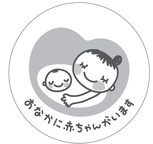
展開形 2(白マド付き) *スキケイはアタリ