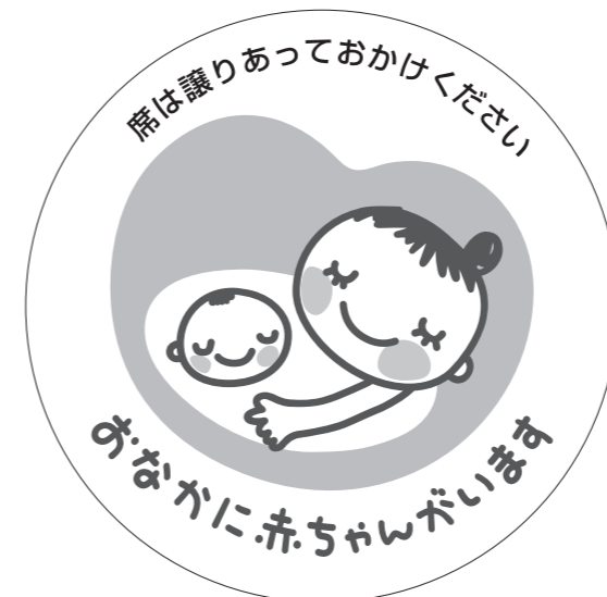
展開形使用例①(白マド付き) *スキケイはアタリ