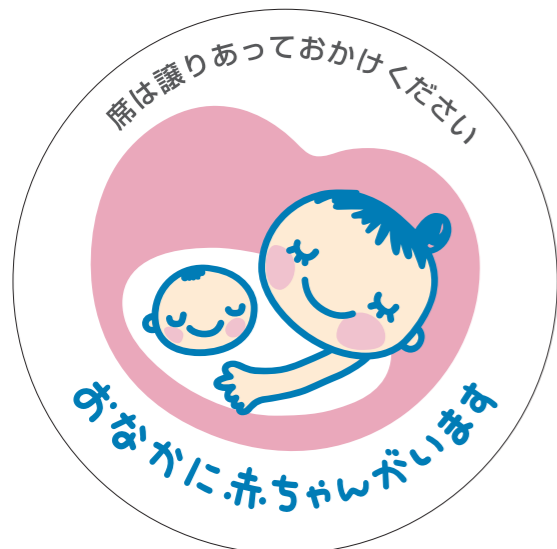
展開形使用例①(白マド付き) *スキケイはアタリ