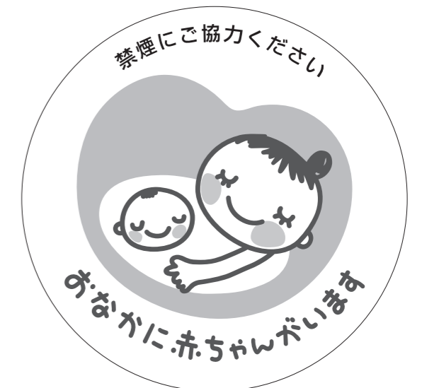
展開形使用例②(白マド付き) *スキケイはアタリ