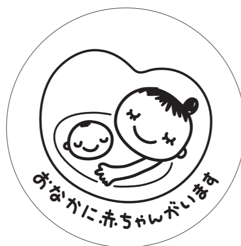
展開形 2(白マド付き) *スミケイはアタリ