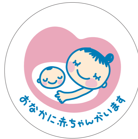
展開形 2(白マド付き) *スキケイはアタリ