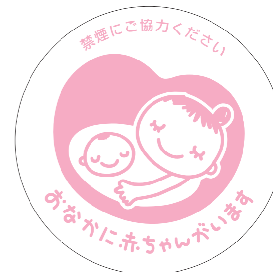
展開形使用例②(白マド付き) *スミケイはアタリ