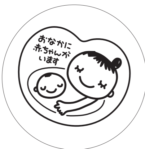
展開形 1(白マド付き) *スミケイはアタリ