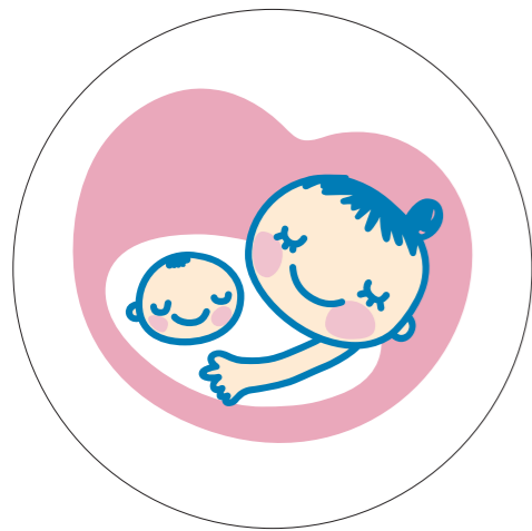
基本形(白マド付き) *スキケイはアタリ