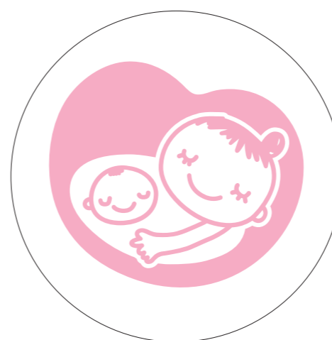
基本形(白マド付き) *スミケイはアタリ