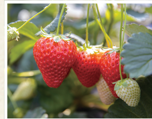
とちぎのいちご(栃木県)