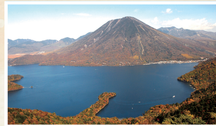
男体山と中禅寺湖(日光市)