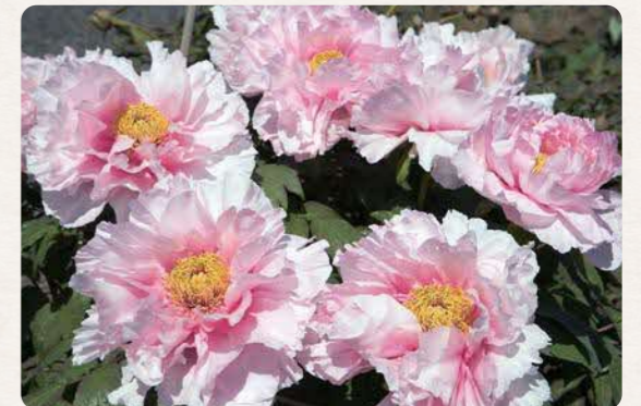
「大根島のぼたん」 (島根県松江市)